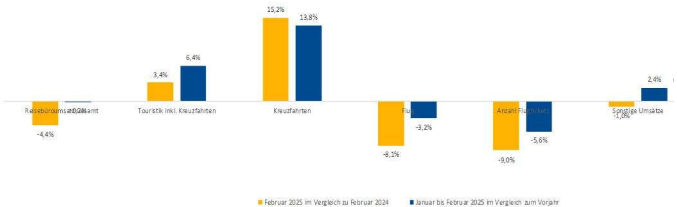
Fakturierte Werte Januar bis Februar 2025 vs. 2024